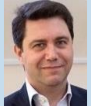
GERENTE DE COORDINACIÓN DE LA PRESIDENCIA DEL COLEGIO DE AUDITORES GENERALES DE LA AGN