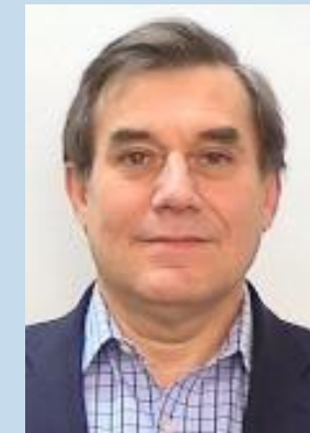
ESPECIALISTA SENIOR EN GESTIÓN FINANCIERA BANCO MUNDIAL