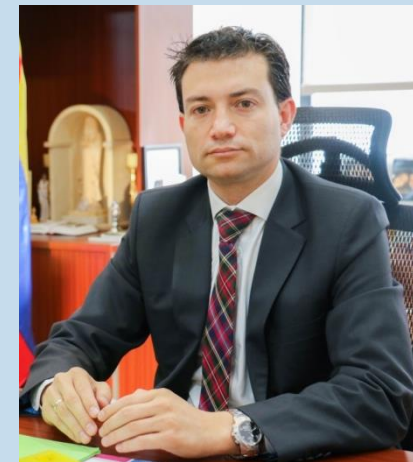
AUDITOR GENERAL DE LA REPÚBLICA