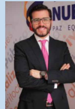
DIRECTOR DE PARTICIPACIÓN, TRANSPARENCIA Y SERVICIO AL CIUDADANO - DAFP