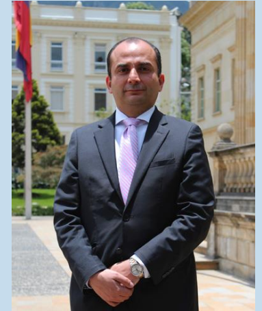
SECRETARIO DE TRANSPARENCIA DE LA PRESIDENCIA DE LA REPÚBLICA