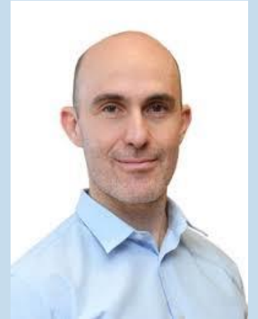
PROFESOR DEL INSTITUTO TECNOLÓGICO AUTÓNOMO DE MÉXICO ITAM

Congreso Internacional por la modernización fiscal, la lucha anticorrupción y la construcción de paz