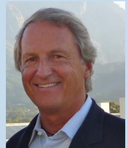
PROFESOR CLAREMONT GRADUATE UNIVERSITY (CALIFORNIA)

Congreso Internacional por la modernización fiscal, la lucha anticorrupción y la construcción de paz