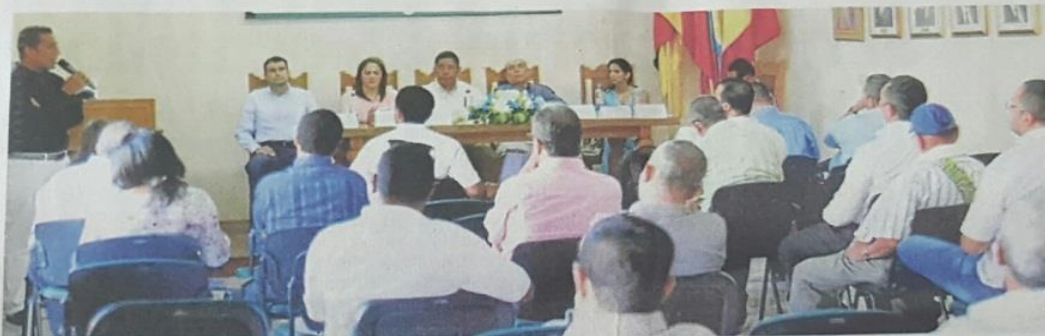
LA COMISIÓN DE MORALIZACIÓN de Bolívar está integrada por los entes de control y jurídicos como las contralorías, la Procuraduría Regional, la Fiscalía, el CTI y la Judicatura. Veedores acudieron al llamado de estas entidades. //AROLDO MESTRE.